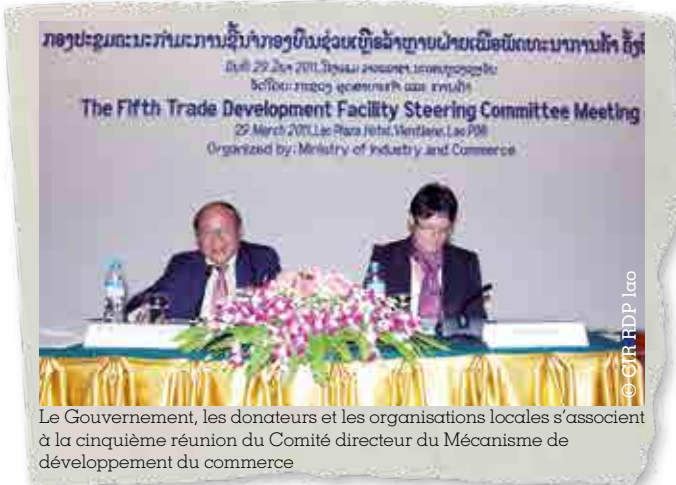
Le Gouvernement, les donateurs et les organisations locales s'associent à la cinquième réunion du Comité directeur du Mécanisme de développement du commerce

Au cours des dernières décennies et en dehors de la crise financière asiatique, la RDP lao a enregistré des taux de croissance élevés (6% en moyenne) et déploie aujourd'hui des efforts considérables pour faire fond sur ces résultats. La stratégie nationale d'exportation et l'Etude Diagnostique sur l'Intégration du Commerce (EDIC) ont établi les bases nécessaires à la réalisation des objectifs commerciaux du pays.