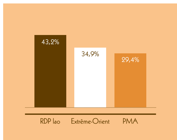
Aide pour le commerce: panorama 2009